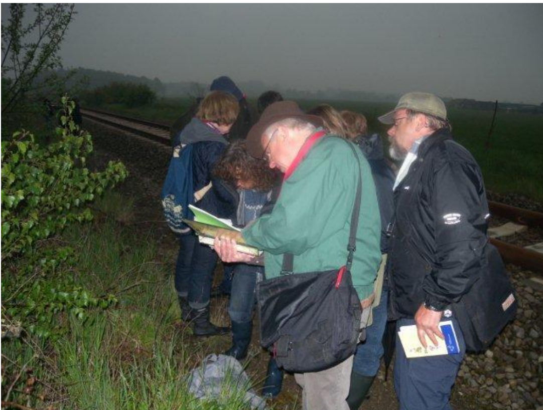
Zou het wel geoorde zuring zijn?